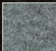
庵治細目超特級石