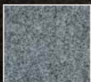
庵治細目石ゆらぎ