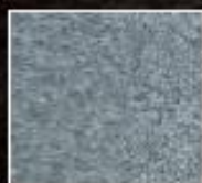
庵治細目石いのり