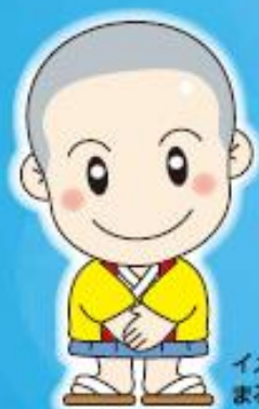
イメージキャラクター まるくに君

お墓から永代供養・樹木葬から 納骨堂まで、ご先祖様のご供養の お手伝いをいたします。